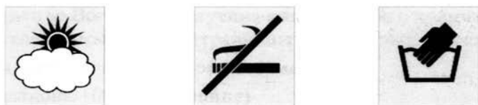
Рис. 1.6. Примеры пиктограмм