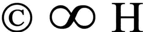
Рис. 1.7. Примеры символов