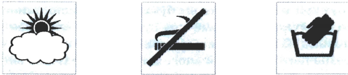
Рис. 1.1. Примеры пиктограмм