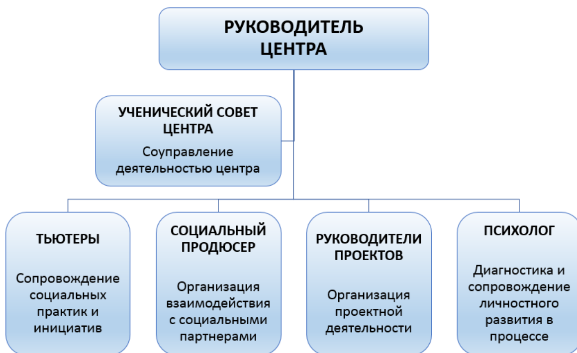
Рис. 4. Организационная структура центра