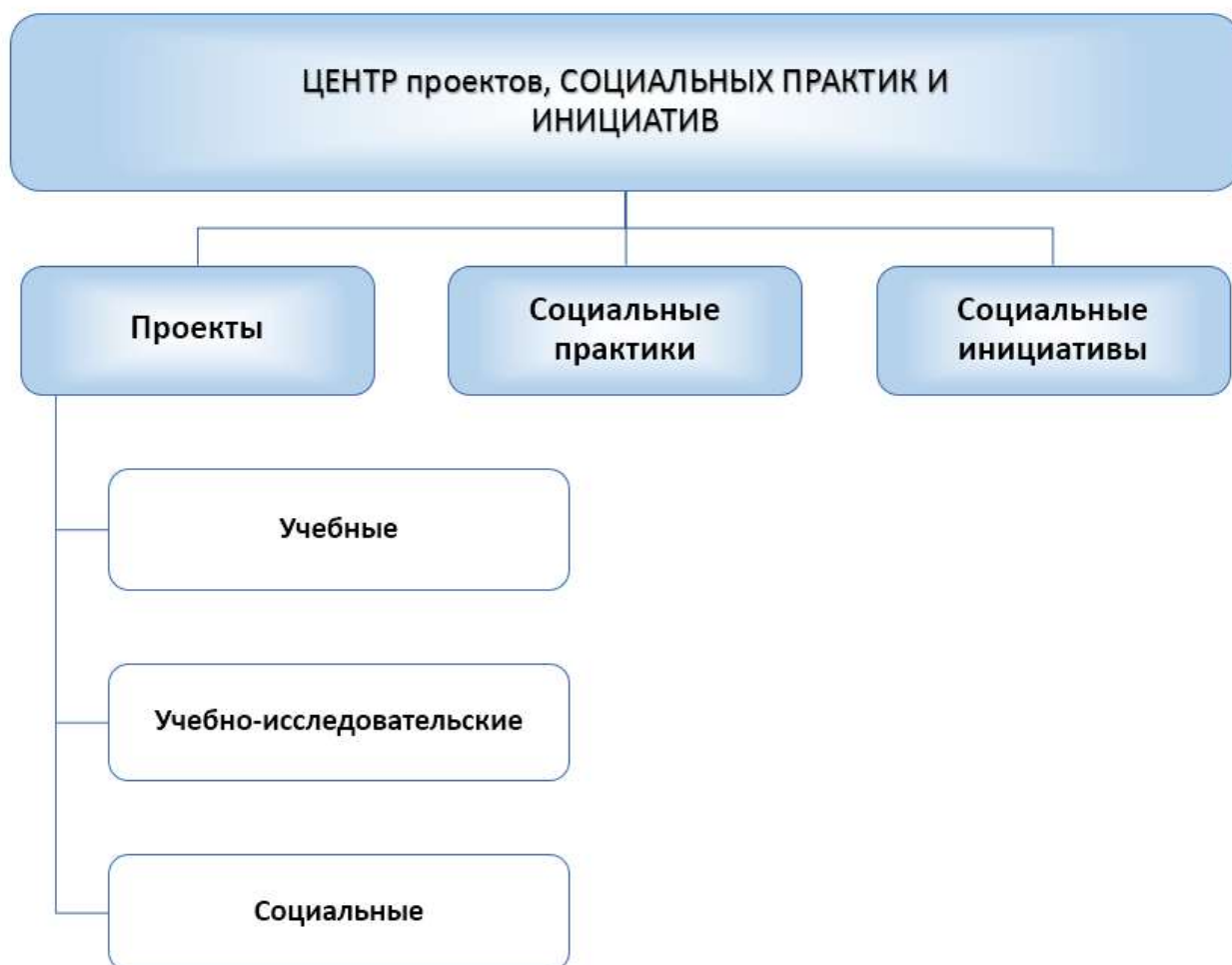
Рис. 1. Модель Центра проектов социальных практик и инициатив

В качестве продукта реализации инновационной образовательной программы выступает модель «Центр проектов, социальных практик и инициатив».