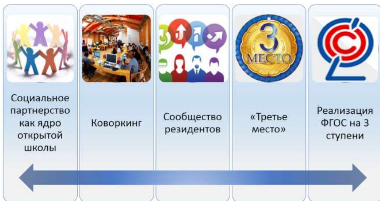
Рис. 2. Концептуальные идеи «Центр проектов, социальных практик и инициатив»

В основе деятельности центра лежат следующие концептуальные идеи: